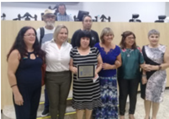
A homenageada com os membros da AVLA