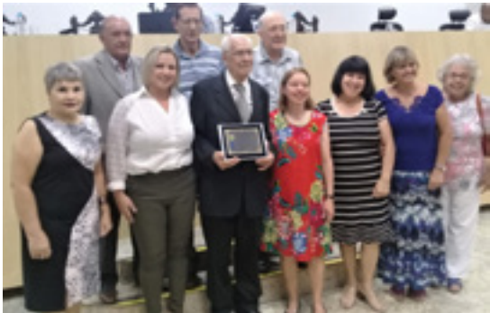
0 homenageado com os membros da ATL