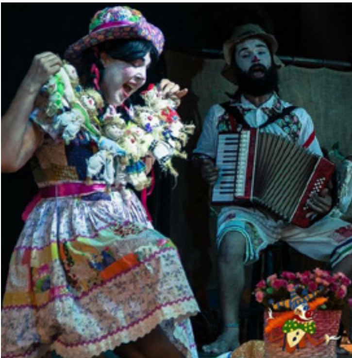
A MENINA E O SABIÁ

Ao todo serão mais de 30 artistas e técnicos que desfilarão suas habilidades em dois dias de eventos. O excelente nível artístico e a interação com a plateia,