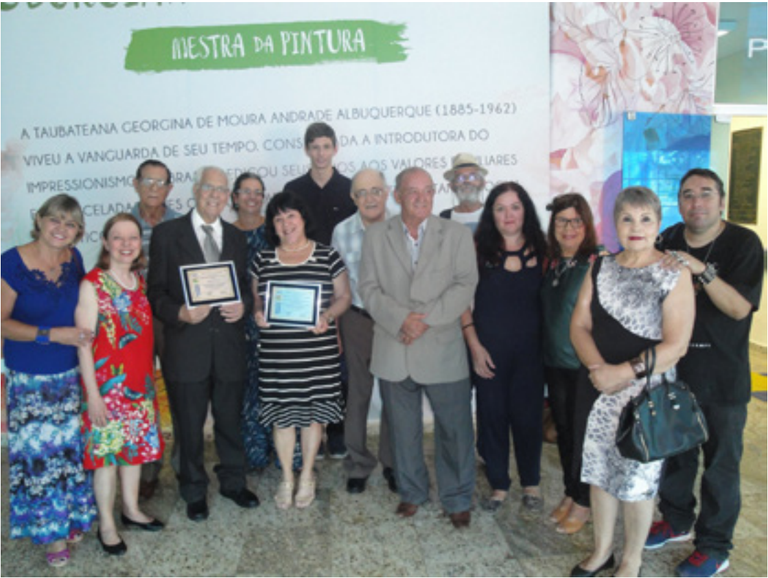
Os homenageados com os membros da AVLA e ATL