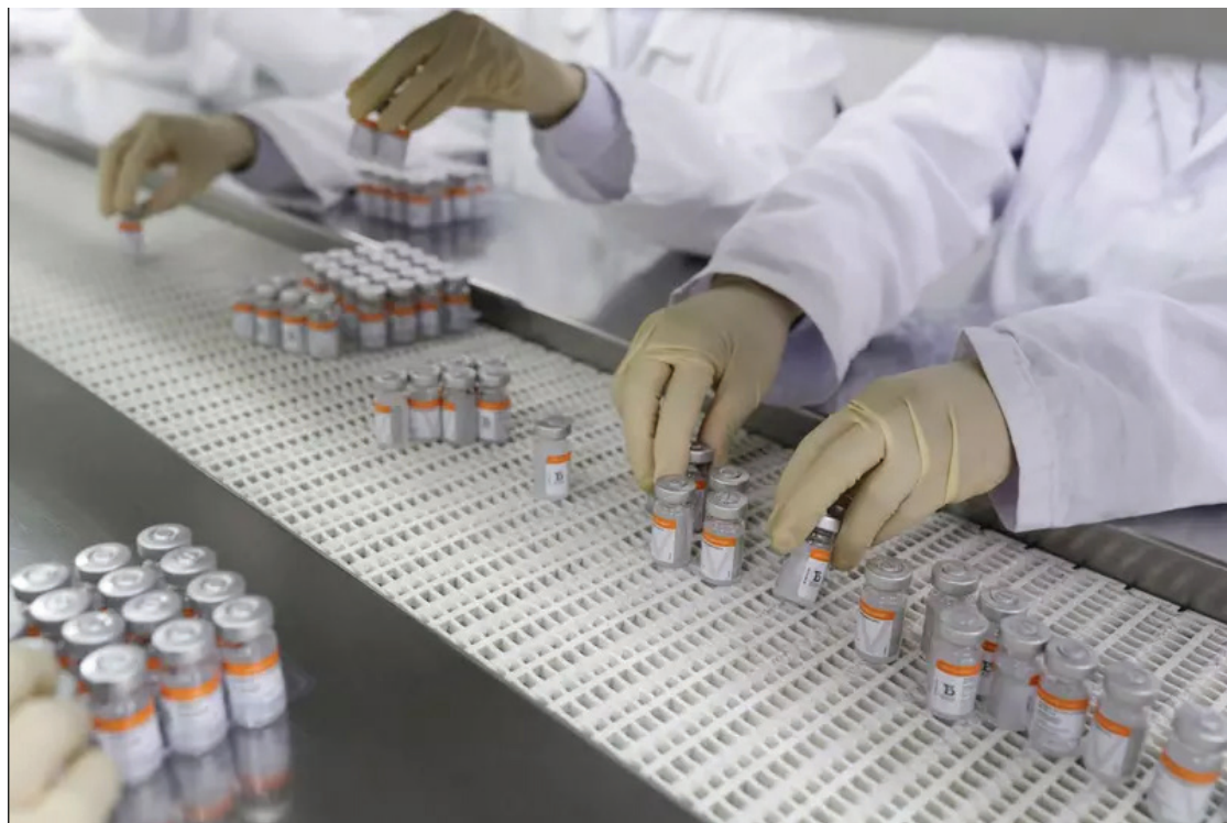
Produção de vacina Coronavac no Butantan