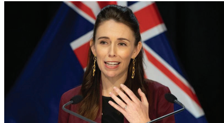
O desempenho da premiê da Nova Zelândia, Jacinda Ardern, chamou atenção de pesquisadores brasileiros