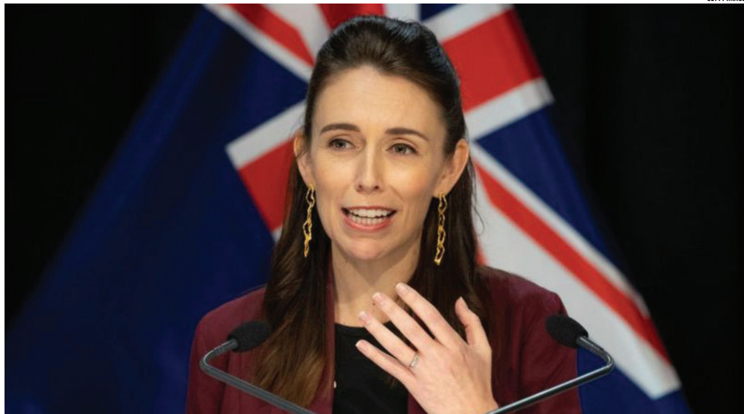
O desempenho da premiê da Nova Zelândia, Jacinda Arden, chamou atenção de pesquisadores brasileiros