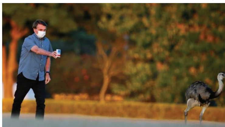
Bolsonaro com caixa de cloroquina, em foto de julho de 2020; presidente apostou em medicamentos sem eficácia comprovada contra a covid-19

A conclusão foi que municípios com prefeita tiveram, em média, 25,5 mortes por 100 mil habitantes a menos do que aqueles em que os chefes do Executivo local eram homens — uma diferença de 43,7% na mortalidade.