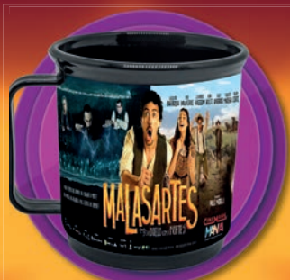
BRINDE DA SEMANA

GANHE UM COPO EXCLUSIVO DO FILME MALASARTES E O DUELO COM A MORTE NA COMPRA DE UM INGRESSO PARA QUALQUER FILME COM O SEU CARTÃO CINEMARK MANIA.