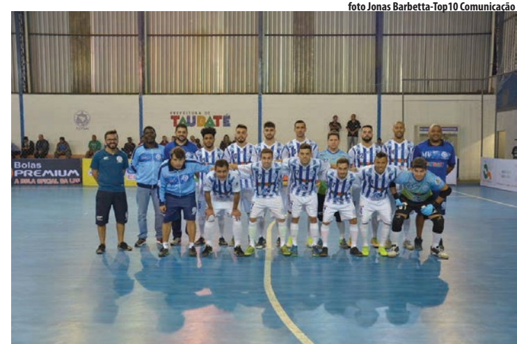
ADC Ford Taubaté enfrenta Barueri pelas quartas-de-final da Liga Paulista

➤ Primeiro jogo será neste domingo contra Barueri