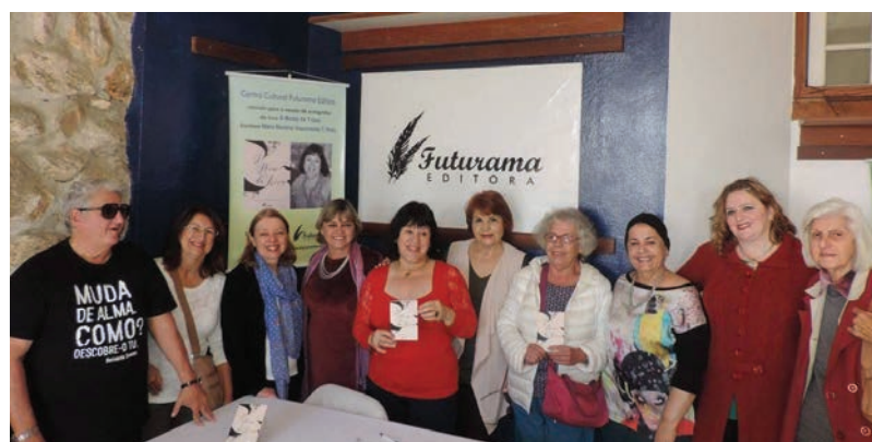
Membros da Academia