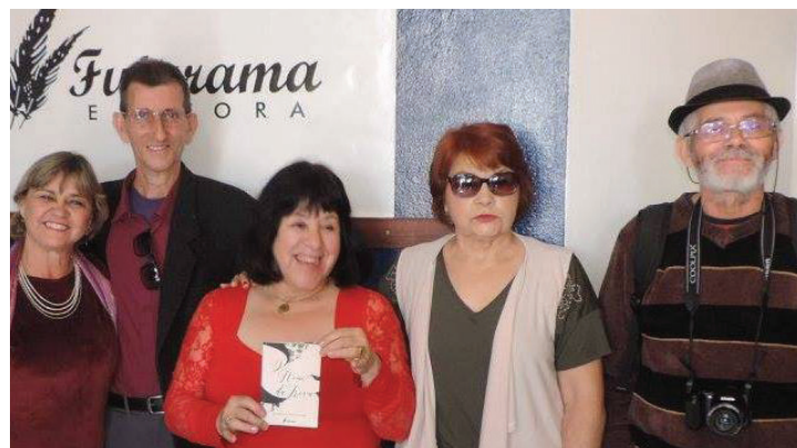
Membros da Academia