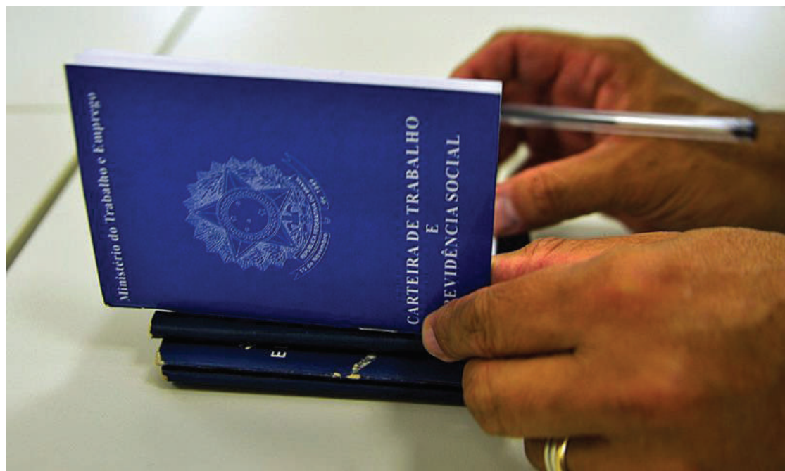
Decisão deve beneficiar trabalhadores com carteira assinada