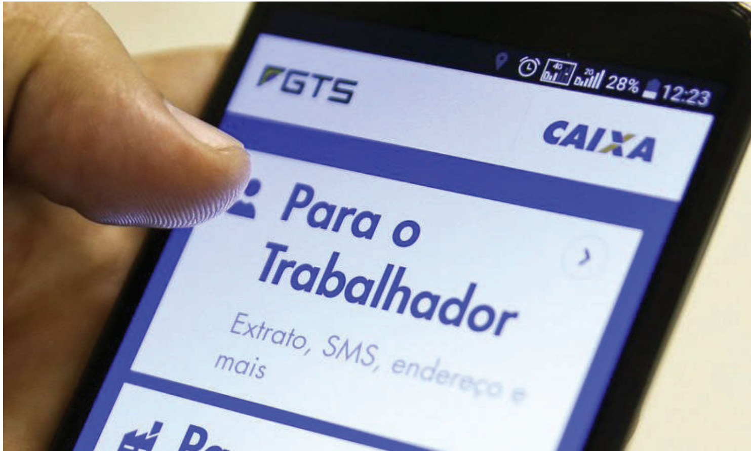
Expectativa dos especialistas é de decisão favorável aos trabalhadores em julgamento do STF que pode alterar a taxa de correção monetária do FGTS