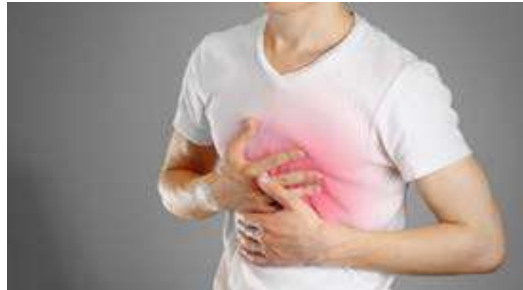
A dor do refluxo pode ser tão forte que, não raro, ela é confundida com um infarto

“Isso pode ser feito por meio de exames de sangue, e o acompanhamento é importante quando o paciente é idoso, está imunossuprimido ou internado numa UTI [Unidade de Terapia Intensiva]”, destaca o médico.