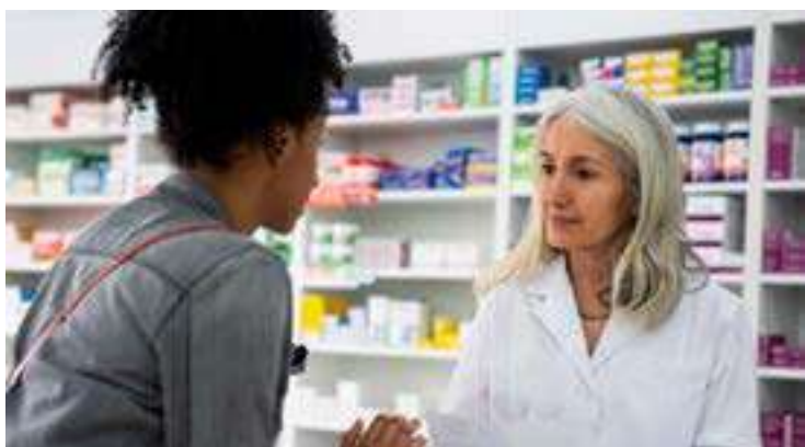
Remédios de tarja vermelha devem ser comprados apenas com prescrição médica

O médico lembra que, em muitos casos, o uso de omeprazol e companhia precisa se prolongar por quatro a oito semanas.