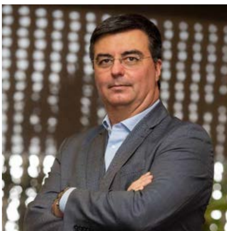
Leia mais no site do DT.

Esta é a primeira visita de Cervone vai a Taubaté desde que assumiu o posto de presidente no início do ano passado, representando cerca de oito mil indústrias paulistas. A ideia da palestra é despertar no público a consciência sobre as mudanças nos setores de energia, infraestrutura, qualificação, saúde, alimentos, infraes-